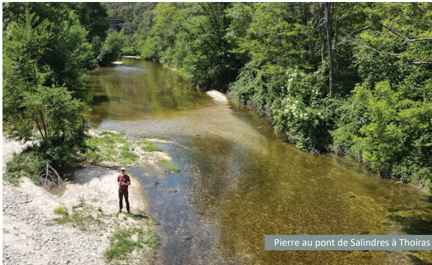
Pierre au pont de Salindres à Thoiras

Selon le Code de l'environnement, le propriétaire d'une parcelle située en bord de rivière est réglementairement tenu d'entretenir régulièrement le cours d'eau. Pierre nous en dit plus !