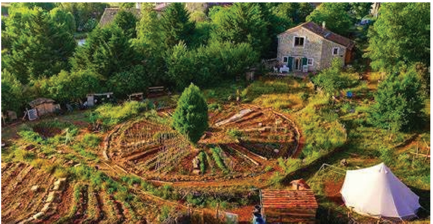
Une ferme de permaculture

« Après un démarrage dans la vie professionnelle à taper du code toute la journée face à un écran, je voulais faire quelque chose qui ait du sens et qui soit en harmonie avec mes valeurs. »