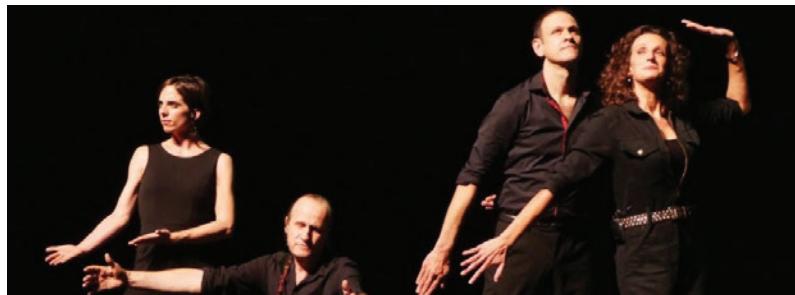
Les Grandes Gueules