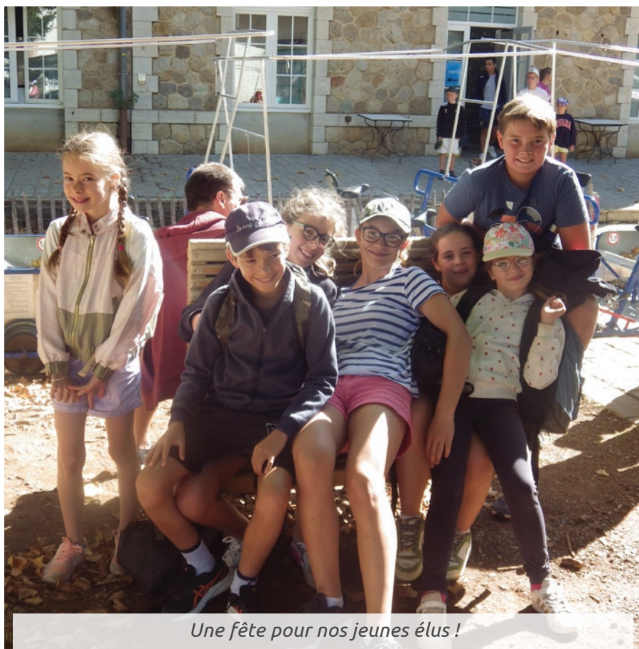
Une fête pour nos jeunes élus !