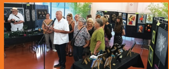
Au Salon des artistes et artisans