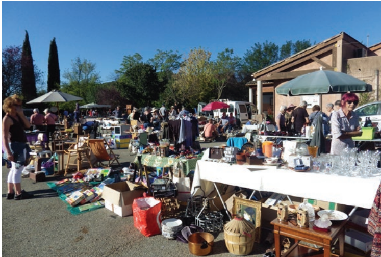
Que d'affaires à faire !

Le Comité des fêtes, avec le soutien de la municipalité, a organisé un vide grenier le samedi 30 septembre. La manifestation a remporté un vif succès sous un ciel particulièrement favorable. La Place du foyer a été prise d'assaut bien avant le lever du jour. Rendons hommage aux organisateurs et aux exposants qui doivent se lever très tôt !