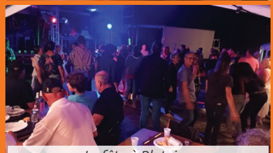
La fête à Blateiras