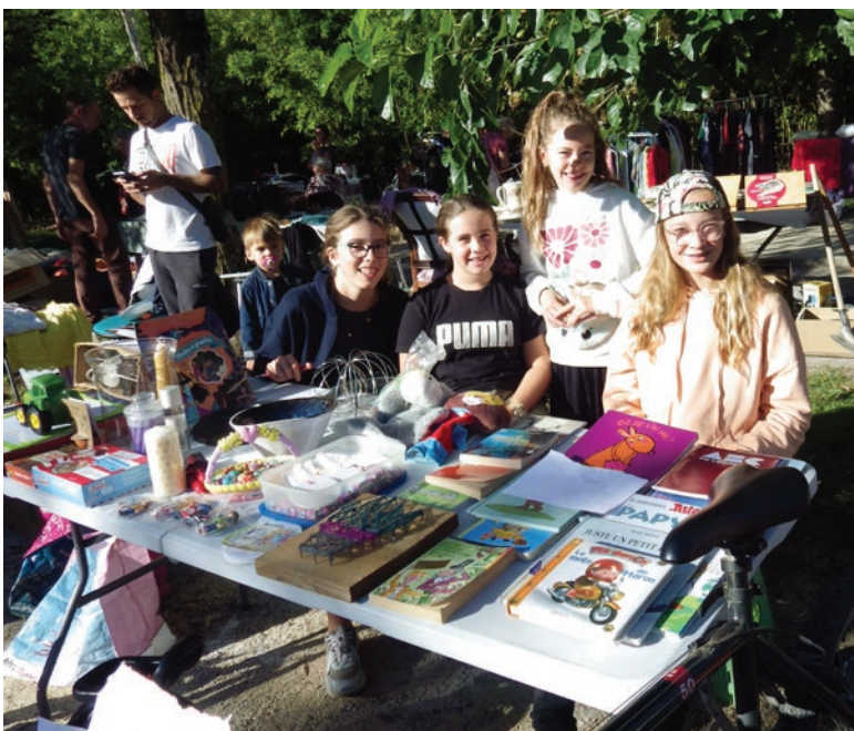
Le stand tenu par nos jeunes élus