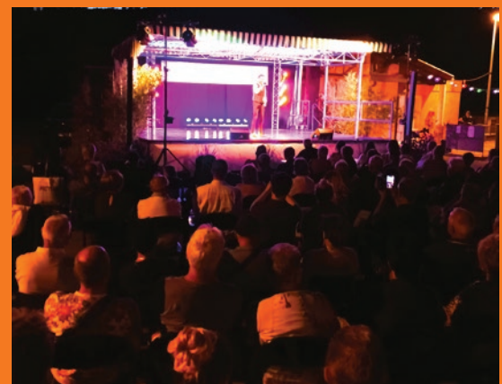
Le Grand Prix de la chanson